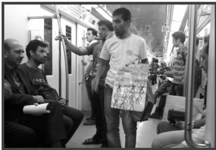
یکی از کوچکترین عوامل تغییرات نرم فرهنگی جامعه امروز

پر واضح است که نقد ما به رویکردها و سیاست هاست، وگرنه حقیقتاً (جدای از برخی کارمندان جزء) غالب مسوولین دانشگاه از جمله معاونت فرهنگی، مدیریت امور خوابگاه ها و مدیریت فرهنگی دانشگاه که با آغوش باز از ما استقبال نمودند، اما سیاه چاله ی پروژه های عمرانی، عدم حضور مسوولین اصلی دانشگاه در نیمی از روزهای هفته و بوروکراسی اداری پوسیده ی دانشگاه و احتمالاً پروژه هایی مثل جشن صد سالگی (و مخارج حاشیه ای) مانع از پیشروی مقدمات کارهای فرهنگیست و اگر روند کنونی به همین منوال ادامه یابد با گسترش روز افزون آمار آسیب های فرهنگی، اجتماعی، روانی، اعتیاد و کلکسیون ی از اتفاقات عجیب و غریبی که قطعاً از رخ داد آنها با خبر هستید، خواهیم بود.